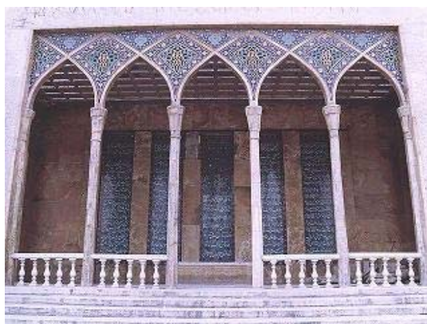
آرامگاه صائب تبریزی در اصفهان

* رنسانس در اروپا، با شوریدن بر زبان پُرتگَلّف و دشوار قرون وسطا، ضمن غلبه بر آریستوکراسی ادبی، کوشید تا ذهن و زبان را در برخورد با جهان و جامعه، آزاد کند. به عبارت دیگر: رنسانس در واقع، تحول در سبک های ادبی و تغییر در سلیقه های هنری بود و صائب تبریزی، برجسته ترین نماینده این تحول و تغییر در عصر صفوی بشمار می رود.