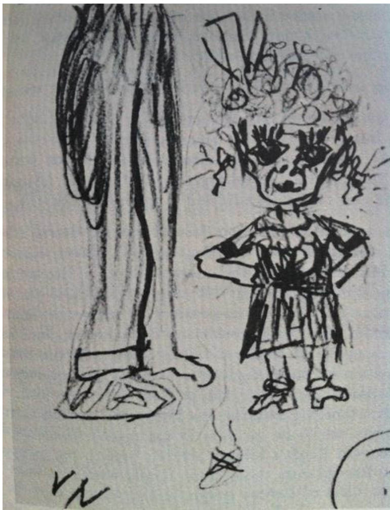
تصویر از Annotated Lolita اثر آلفرد اپل

۲۵،۵ بیت شعری من در آوردی که بازتابنده‌ی اشعار شاعران رمانتیک