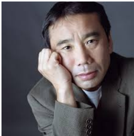
Haruki Murakami هاروکی موراکامی

هاروکی موراکامی (به ژاپنی: 村上春樹) (زاده ۱۲ ژانویه ۱۹۴۹) نویسنده برجسته ژاپنی و خالق رمان کافکا در ساحل و مجموعه داستان بعد از زلزله است. داستان‌های او اغلب نهیلیستی و سوررئالیستی و دارای تم تنهایی و ازخودبیگانگی است.