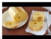
34 Baumkuchen نوعی کیک که اصل آن آلمانی است

سعی کردم رشد حلقه ها در خود را تجسم کنم اما تنها چیزی که بنظرم آمد لایه ای مانند کیک باومکوشن ۳۴ بود. گفتم: