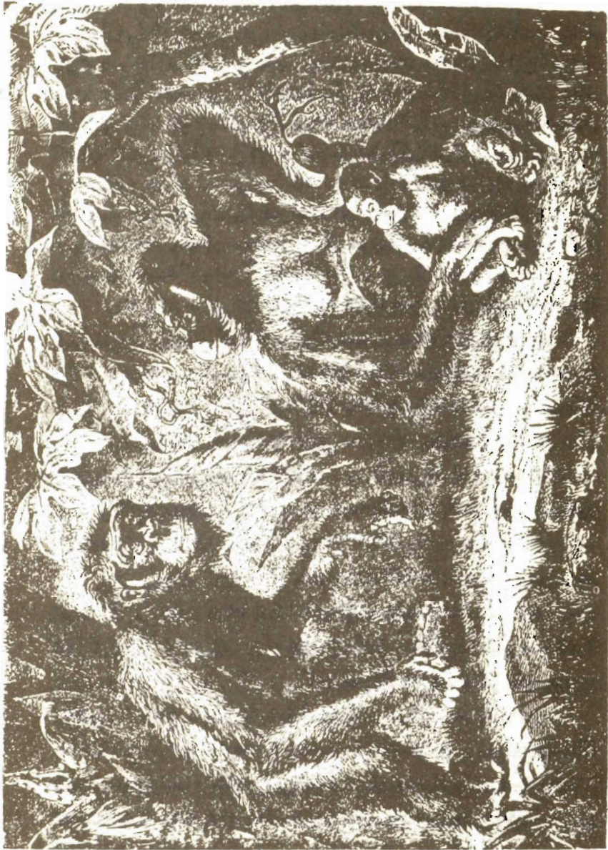
يك خانواده از اورانگ اوتان