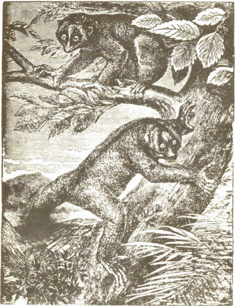
دو تن از لیسورها