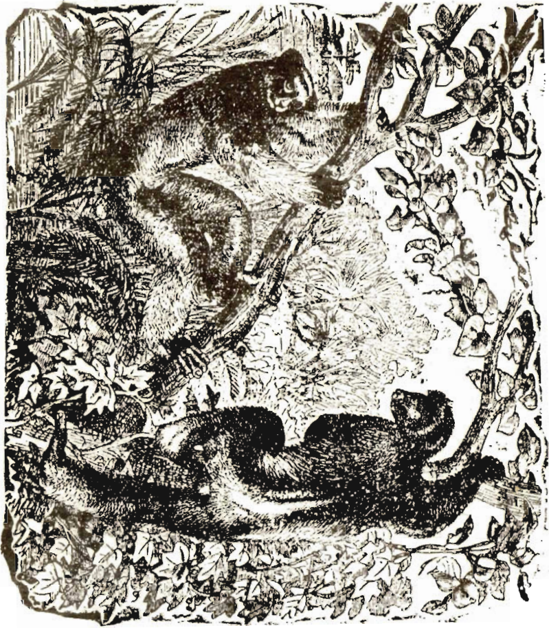
دو تن از لیمورها

از آنسو این بی گفتگوست که آنچه در نهاد کسی یا چیزی نهاده شده دیگر نتواند بود . پستی خیمهای آدمی همانهاست که بوده است و هست و امید دیگر شدن، با آنها نتوان بست .