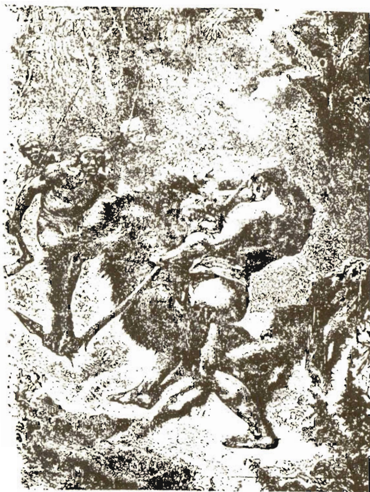
نبرد اورانك اوتان با آدمی

را برداشتم و در معاینه مغز دیده شد که قسمت عمده آن بکلی له شده است . اگر چه معالجات طبی نمی‌توانند عضو لطیفی چون مغز را پس از له شدن بحال اولیه برگردانند معذک بیمار نجات یافت .